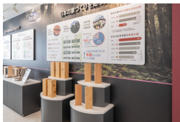
▲木材の目利き(イメージ)

主に木造住宅をご検討のお客様に対して、木材や2×4工法と2×6工法の違いについて、模型により分かりやすく紹介します。特に木材については、木の種類による特徴の違いから木材の目利き方法まで、お客様参加型で楽しく学んでいただけます。また2×4工法・2×6工法については、実物大模型を使って解説しているため、その特徴についてより理解が深まりやすいようになっています。