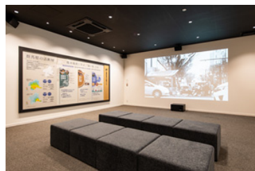
▲災害対策体感シアター(イメージ)

これまで災害対策については「地震」を中心に紹介してきましたが、近年増加している水害の面からも、減災のためのレジリエンス機能の重要性をお伝えできるようになりました。大画面スクリーンでの迫力の映像システムと資料により、住宅の災害対策を実感しながら学べます。