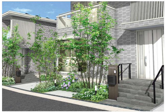
歴史由来のある植物を多用した豊かな植栽計画※10

このような魅力的なエリアで、世界遺産・平等院のように、後世に受け継がれていく家・まちという願いを込めて、宇治エリアにふさわしいまちなみをガイドラインにより形成します。歴史に育まれた品格ある閑静な佇まいを目指し、豊かな植栽で景観を統一。外構には、古来より万葉集などの和歌にも詠まれた「アジサイ」や、細いリボンのような赤紫の花が印象的な「トキワマンサク」を採用することで、格調高いまちなみを演出します。