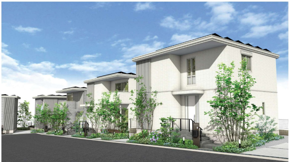
『ユナイテッドハイムパーク宇治木幡』のまちなみイメージ※10