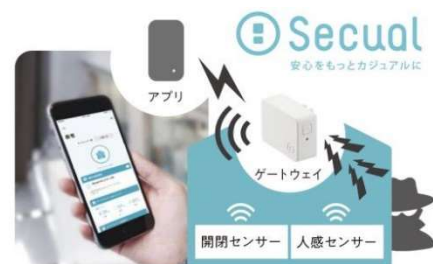
防犯・家族の見守り機能Secual

自然災害時の安心だけでなく日常の安心も確保するため、ホームセキュリティ「Secual(セキュアル)※8」を全邸に設置します。壁に設置して周辺の人の動きを検知する人感センサーと、窓やドアに設置して振動や開閉等を検知する開閉センサーを採用。異常時にはゲートウェイ機器と連携して警報ブザーを鳴らすとともに、スマートフォンアプリへの通知※9も行うため、速やかに異常を知ることができます。まち全体で防犯意識を向上させることで、安心して永く暮らせるまちづくりをサポートします。