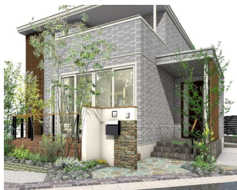
「割栗石」や「アオダモ」を配した自然豊かな外構計画 ※9

京都や大阪市など近隣都市へのアクセス利便と同時に、自然への近さが魅力でもある栗東市にふさわしいまちなみをガイドラインにより形成します。自然と共生する地域の魅力に配慮し、自然石（割栗石）を活用した外構、さらにシンボルツリーとしての「アオダモ」を中心にした緑豊かなエクステリア・デザインを採用しました。また、屋外の照明計画により映える景観も魅力です。日中と夜間で異なる世界観を演出します。