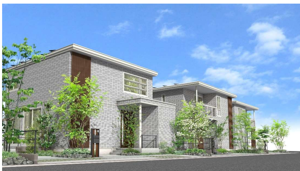
『ユナイテッドハイムパーク栗東小平井』のまちなみイメージ ※9

周囲には子育て家族にとって、安心して快適な住環境が整えられており、買い物施設や病院など充実した生活施設の他、自然共生型アウトドアパークにもアクセスしやすく、伸び伸びと子育てができる環境も魅力です。このような利便性の高い都市機能と、子育て環境に相応しい自然を結びつけるくらしの拠点となるのが『ユナイテッドハイムパーク栗東小平井』です。