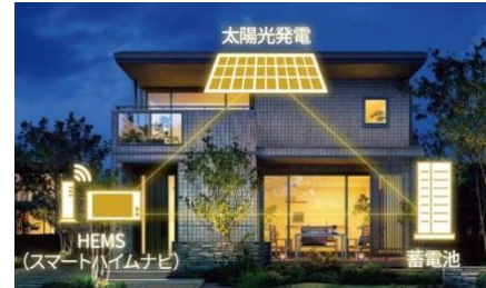
3点セット(PV、蓄電池、HEMS)を全邸搭載

快適な室内環境の確保やカーボンニュートラル社会への貢献を目指し、全邸を『ZEH』仕様※1とします。高い品質管理のもと大半が工場生産される高気密・高断熱の躯体性能をベースに、PV(4kW以上推奨)、蓄電池(4.9kWh以上※2)、HEMS「スマートハイムナビ」の3点セットを全邸で採用。可能な限り自然エネルギーを活用し、電力価格高騰リスクにも対応するグリーンな暮らしを実現します。