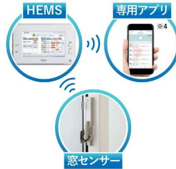
窓施錠開閉見守りシステム