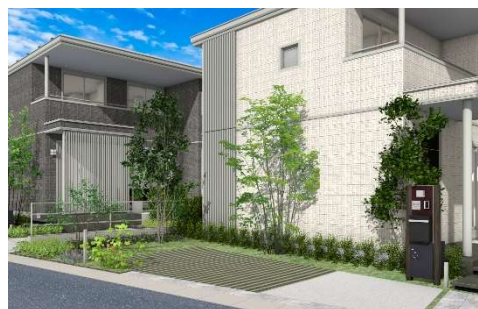
エクステリアイメージ *3

駐車スペースは植生ブロックと芝生を採用するなど外構の緑化率を高めるほか、ロードサイドは保水性タイル仕上げで統一し、建物周囲には保水性砂利敷エリアを設定。雨水の自然浸透機能を活用し排水負担の軽減を図るとともに、緑あふれるまちなみを形成し、自然と調和した持続可能で魅力ある地域づくりを目指します。