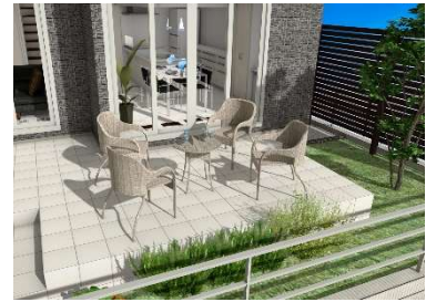
主庭のエクステリアイメージ※3