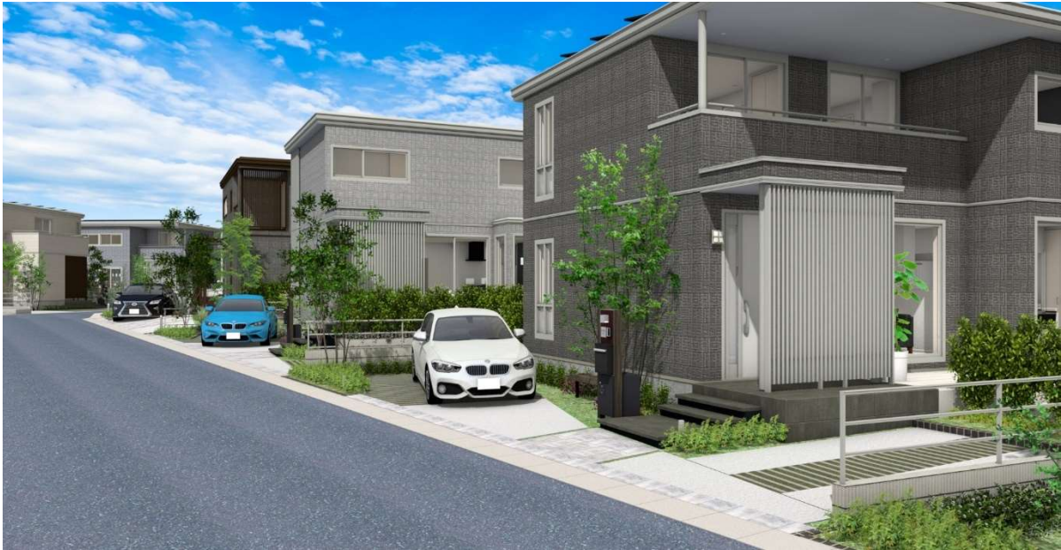
『ユナイテッドハイムパーク西諫早』まちなみイメージ※3※5

『ユナイテッドハイムパーク西諫早』 https://www.hem-k.com/nishiisahaya/