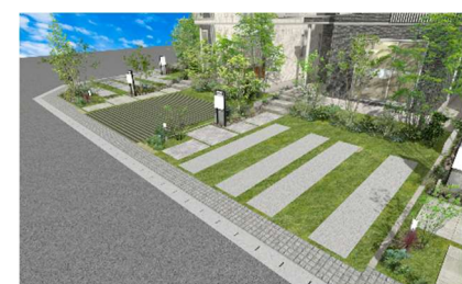
全区画共通して「オープン外構」に統一 自然の変化を感じやすい環境へ