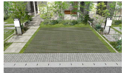
駐車場スペースには、高い緑化基準を設定 レジリエンス性とまちなみづくりを両立

このような緑化計画は雨水流出の抑制効果もあり、下水管の排水負担を抑制することで土地のレジリエンス性の向上に貢献します。