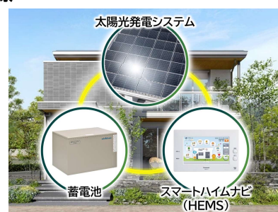
3点セット(PV、蓄電池、HEMS)を全邸搭載

快適な室内環境の確保やカーボンニュートラル社会への貢献を目指し、全邸を『ZEH』仕様※1とします。高い品質管理のもと大半が工場生産される高気密・高断熱の躯体性能をベースに、PV（4kW以上推奨）、蓄電池（4kWh以上※2）、HEMS「スマートハイムナビ」の3点セットを全邸で採用。可能な限り自然エネルギーを活用し、電力価格高騰リスクにも対応するクリーンな暮らしを実現します。