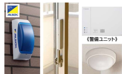
《ALSOKライト》《施錠確認センサー》《空間センサー》

自然災害時の安心だけでなく日常の安心も確保するため、ALSOK「ホームセキュリティ」を全邸に標準付帯します。人体検知方式のセンサーライト「ALSOK ライト」と、窓やドアの異常検知や外出前のクレセント施錠状態を確認できる「施錠確認センサー」、室内には「空間センサー」を設置します。異常時にはお客様のスマートフォンなどに通知が届き、ご自宅の状況を確認できます。また、緊急事態発生時にはALSOK コールセンターに「依頼駆けつけ」ができるセルフセキュリティプランを採用しています。オプションにて「防犯カメラ」の設置も推奨。まち全体で防犯意識を向上させることで、安心して永く暮らせるまちづくりをサポートします。