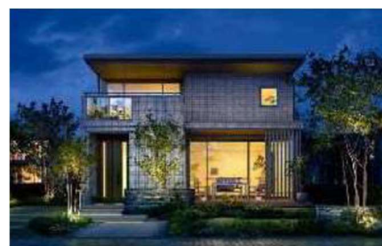
停電時でも電気が使える蓄電池 *6 災害時の在宅避難が可能 *7