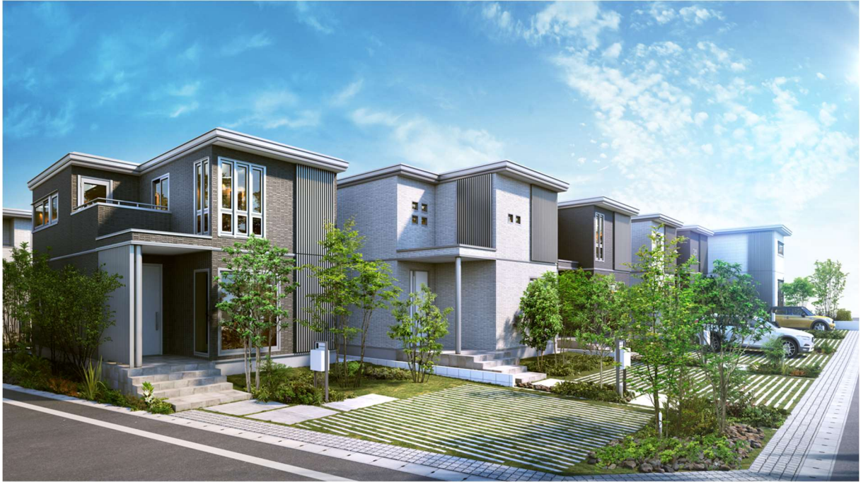
『ユナイテッドハイムパーク蟹江町学戸』のまちなみイメージ※12