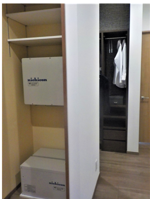
屋内設置型蓄電池を展示

セキスイハイムグループでは国の温室効果ガス削減目標をふまえ、その責任を果たすべくCO 2 削減に貢献する環境貢献商品の開発・普及に努めています。『セキスイファミエスミュージアム岡崎』では、環境貢献商品の中心である「再生可能エネルギーの有効活用（太陽光発電システム・蓄電池）」、「高耐久外装材（タイル外壁・ステンレス屋根）」、「省エネ性強化（高断熱サッシ）」などについて説明します。