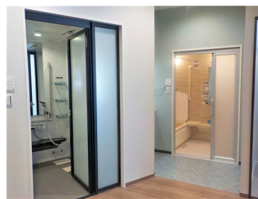
床段差解消が実感できる浴室を展示

また、近年多発している自然災害に備えるため、映像を用いて「災害による停電時も電気が使える暮らし ※2 （レジリエンス性能を有した住宅）」などについてわかりやすく解説します。