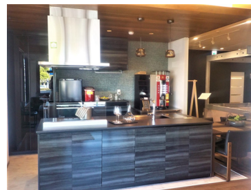
キッチンを最新仕様に全面改装した実物サイズのLDK空間を展示

最新のキッチン・トイレ・洗面化粧台・浴室などの水まわり設備を展示しています。また、家族構成の変化などに伴うプラン変更など、快適に過ごすための設備や新しい暮らしを楽しむための提案をしています。壁クロス、床材、カーテンなどの内装サンプルも展示し、お客様の要望を伺いながらリフォームを計画していきます。