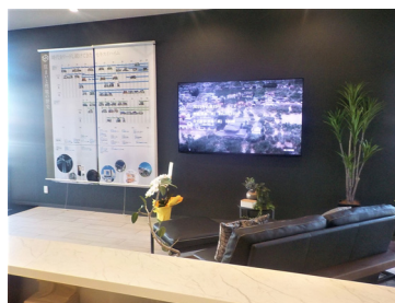
ユニット構造や商品の変遷を解説