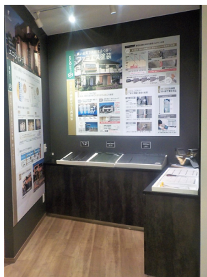
オリジナル高耐久外装を解説