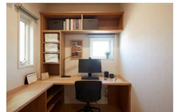
■ 在宅ワーク対応プランの体験 (イメージ)

リビング等の居室に入る前に、玄関ホール内で手洗いやコート収納などを行える間取りとし、ウイルスや花粉を出来る限り居室内に持ち込まない暮らしをイメージしていただけます。在宅ワークスペースにはカウンターデスクや本棚などを設え、オンライン会議も想定した空間設計や快適さを実際に体験できます。