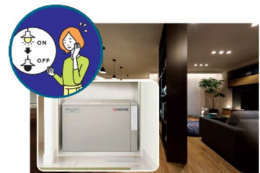
■ 大容量蓄電池(12kWh ※5 )による停電の暮らし体験(イメージ)

『GREENMODEL PARK 箕面森町ピースガーデン』では、平常時では実感が難しい停電時の生活を体験いただくため、実際の停電状況を再現し、在宅避難を疑似体験していただくことが可能です。大容量のPVや蓄電池を搭載した住宅は、停電時にどれだけの電気を使用できるのか実際に体験いただけます。