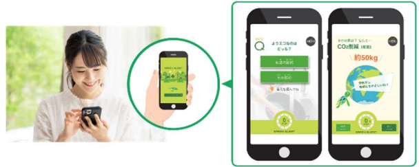
■ 「グリーンクエスト」でエコクイズに挑戦

地球環境の大切さや可能な限り自宅で発電した電気を使うグリーンな暮らしについて、プロジェクションマッピングなどにより見える化し、分かりやすくナビゲートします。