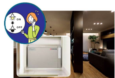
■ 大容量蓄電池(12kWh ※5 )による停電の暮らし体験(イメージ)

『GREENMODEL PARK 西宮北口』では、平常時では実感が難しい停電時の生活を体験いただくため、実際の停電状況を再現し、在宅避難を疑似体験していただくことが可能です。大容量の PV や蓄電池を搭載した住宅は、停電時にどれだけの電気を使用できるのか実際に体験いただけます。