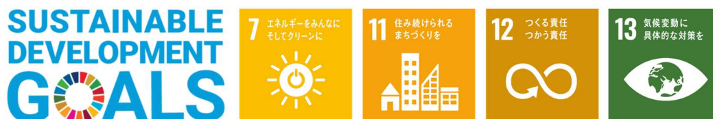
■ 『GREENMODEL PARK 西宮北口』で目指す SDGs

これらの商品で提案しているニューノーマル時代にふさわしい新しい暮らし方(地球環境にやさしい暮らし、新しい生活様式に対応した暮らし、自然災害にも対応できるレジリエントな暮らし)は、住宅購入検討者にとって見える化しにくく、その生活ベネフィットを実感することが難しいという側面があります。セキスイハイム誕生 50 周年を機に、スマートハウスの一層の訴求力向上を推進しており、リアルな生活シーンを体験できる『GREENMODEL PARK 西宮北口』により、新しい暮らし方をわかりやすい形で提案します。SDGs の実現も目指しながら、社会課題解決に貢献する住宅の普及を加速していきます。