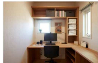
■在宅ワーク対応プランの体験(イメージ)

また、当社オリジナルの換気・全室空調システム「快適エアリー」による適正な換気と快適な温熱環境も体感できます。