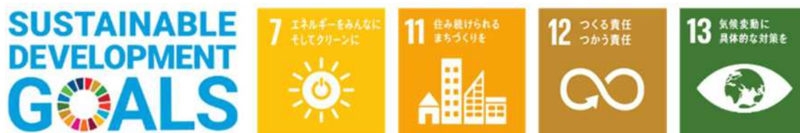
■『GREENMODEL PARK 太田』で目指す SDGs

これらの住まいで提案しているニューノーマル時代にふさわしい新しい暮らし方(地球環境にやさしい暮らし、新しい生活様式に対応した暮らし、自然災害にも対応できるレジリエントな暮らし)は、住宅購入検討者にとって見える化しにくく、その生活ベネフィットを実感することが難しいという側面があります。セキスイハイム誕生 50 周年を機に、スマートハウスの一層の訴求力向上を推進しており、リアルな生活シーンを体験できる『GREENMODEL PARK 太田』により、新しい暮らし方をわかりやすい形で提案します。SDGs の実現も目指しながら、社会課題解決に貢献する住宅の普及を加速していきます。