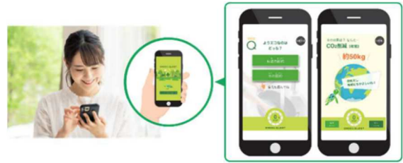
■「グリーンクエスト」でエコクイズに挑戦

地球環境の大切さや可能な限り自宅で発電した電気を使うグリーンな暮らしについて、プロジェクションマッピングなどにより見える化し、分かりやすくナビゲートします。