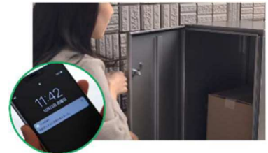
■HEMSと連携した宅配BOXの荷受け体験(イメージ)

HEMS ※3 と連携した宅配 BOX により、スマートフォンで配達状況の確認が可能 ※4 となります。宅配のデモ体験により、配達物の受取確認や再配達依頼の手間解消などの利便性が実感できます。