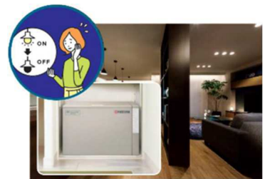
■大容量蓄電池(12kWh) ※5 による停電の暮らし体験(イメージ)

『GREENMODEL PARK 太田』では、平常時では実感が難しい停電時の生活を体験いただくため、実際の停電状況を再現し、在宅避難を疑似体験していただくことが可能です。大容量の PV や蓄電池を搭載した住宅は、停電時にどれだけの電気を使用できるのか実際に体験いただけます。