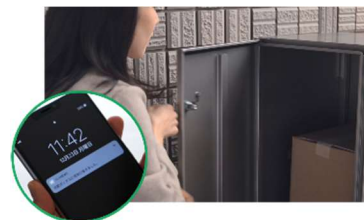
■ HEMS と連携した宅配 BOX の荷受け体験 (イメージ)

HEMS ※3 と連携した宅配 BOX により、スマートフォンで配達状況の確認が可能 ※4 となります。宅配のデモ体験により、配達物の受取確認や再配達依頼の手間解消などの利便性が実感できます。