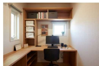
■ 在宅ワーク対応プランの体験 (イメージ)

また、当社オリジナルの換気・全室空調システム「快適エアリー」による適正な換気と快適な温熱環境も体感できます。