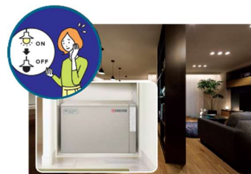
■ 大容量蓄電池 (12kWh ※5 ) による停電の暮らし体験 (イメージ)

『GREENMODEL PARK 播磨中央』では、平常時では実感が難しい停電時の生活を体験いただくため、実際の停電状況を再現し、在宅避難を疑似体験していただくことが可能です。大容量の PV や蓄電池を搭載した住宅は、停電時にどれだけの電気を使用できるのか実際に体験いただけます。