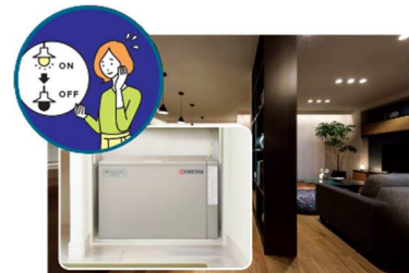
■大容量蓄電池(12kWh) ※5 による停電の暮らし体験(イメージ)

『GREENMODEL PARK 長府紺屋町』では、平常時では実感が難しい停電時の生活を体験いただくため、実際の停電状況を再現し、在宅避難を疑似体験していただくことが可能です。大容量のPVや蓄電池を搭載した住宅は、停電時にどれだけの電気を使用できるのか実際に体験いただけます。