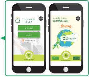
■「グリーンクエスト」でエコクイズに挑戦