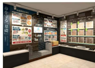
▲経年変化紹介(イメージ)

また、屋根材や断熱材についても実物サンプルや模型を使いながら、その特徴や選び方を紹介します。