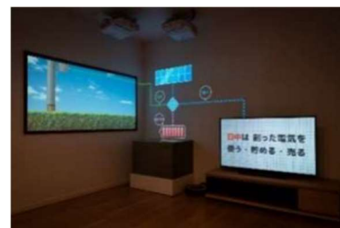
▲未来型スマートハイム体感(イメージ)

セキスイハイムのスマートハウス「スマートハイム」で実現可能な HEMS や IoT による暮らしの利便性、将来の拡張性について、一日の暮らしを再現するプレゼンテーションでお伝えします。また、ニューノーマルへの対応力を高めた換気・空調システムの実演など、日常生活の安心と快適を実現する住設備についても体感していただけます。