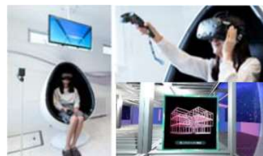
▲ハイムユニット VR(イメージ)