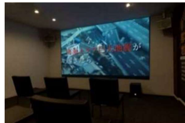
▲巨大地震体感シアター(イメージ)

巨大地震や台風のシミュレーション動画などで構成された映像と大音響に加え、「風の体感」により臨場感をもって体感していただくことで、減災住宅の重要性・必要性を解説します。