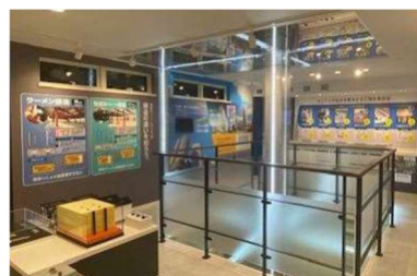
▲鉄骨スケルトン展示(イメージ)

災害発生時における建物倒壊の仕組みや、鉄骨（ブレース・ラーメン）構造住宅の特徴、災害発生直後の不同沈下を抑える地盤改良と基礎について、実物の鉄骨スケルトン展示や基礎模型展示、アニメーション映像を使って、わかりやすく解説します。