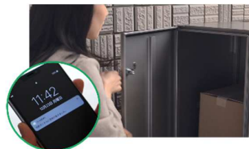
■HEMS と連携した宅配 BOX の荷受け体験(イメージ)

HEMS ※3 と連携した宅配 BOX により、スマートフォンで配達状況の確認が可能 ※4 となります。宅配のデモ体験により、配達物の受取確認や再配達依頼の手間解消などの利便性が実感できます。