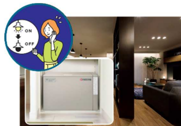
■大容量蓄電池(12kWh ※5 )による停電の暮らし体験(イメージ)

『GREENMODEL PARK 小田原鴨宮』では、平常時では実感が難しい停電時の生活を体験いただくため、実際の停電状況を再現し、在宅避難を疑似体験していただくことが可能です。大容量の PV や蓄電池を搭載した住宅は、停電時にどれだけの電気を使用できるのか実際に体験いただけます。