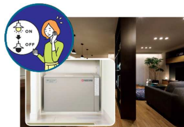
■ 大容量蓄電池 (12kWh ※5 )による停電の暮らし体験(イメージ)

『GREENMODEL PARK 南草津プリムタウン』では、平常時では実感が難しい停電時の生活を体験いただくため、実際の停電状況を再現し、在宅避難を疑似体験していただくことが可能です。大容量の PV や蓄電池を搭載した住宅は、停電時にどれだけの電気を使用できるのか実際に体験いただけます。