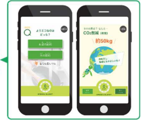
■「グリーンクエスト」でエコクイズに挑戦