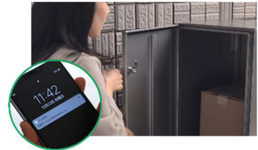
■HEMSと連携した宅配BOXの荷受け体験(イメージ)

HEMS *3 と連携した宅配BOXにより、スマートフォンで配達状況の確認が可能 *4 となります。宅配のデモ体験により、配達物の受取確認や再配達依頼の手間解消などの利便性が実感できます。