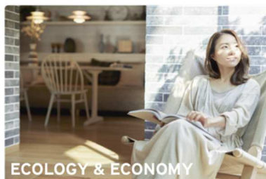
ECOLOGY & ECONOMY