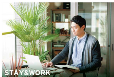
STAY & WORK