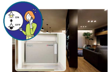
■大容量蓄電池(12kWh) *5 による停電の暮らし体験(イメージ)

『GREENMODEL PARK 相馬小野』では、平常時では実感が難しい停電時の生活を体験いただくため、実際の停電状況を再現し、在宅避難を疑似体験していただくことが可能です。大容量のPVや蓄電池を搭載した住宅は、停電時にどれだけの電気を使用できるのか実際に体験いただけます。