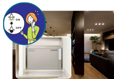
■ 大容量蓄電池(12kWh) ※5 による停電の暮らし体験(イメージ)

『SNOWMODEL PARK 鶴岡』では、平常時では実感が難しい停電時の生活を体験いただくため、実際の停電状況を再現し、在宅避難を疑似体験していただくことが可能です。大容量の PV や蓄電池を搭載した住宅は、停電時にどれだけの電気を使用できるのか実際に体験いただけます。