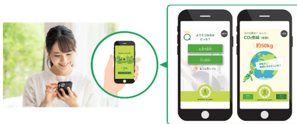
■ 「グリーンクエスト」でエコクイズに挑戦

スマートフォンを片手に家じゅうをご覧いただきながら、新しい暮らしに隠れているエコなポイントをクイズ形式で楽しく学べます。