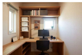
■ 在宅ワーク対応プランの体験(イメージ)

また、第 1 種換気システム「エアーファクトリー」と当社オリジナルの温水式床下ふく射暖房システム「新ウォームファクトリーN」による、適正な換気と快適な温熱環境も体感できます。