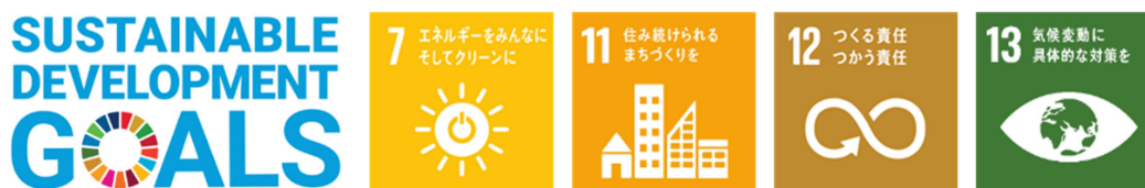
■ 『SNOWMODEL PARK 鶴岡』で目指す SDGs

これらの商品で提案しているニューノーマル時代にふさわしい新しい暮らし方（地球環境にやさしい暮らし、新しい生活様式に対応した暮らし、自然災害にも対応できるレジリエントな暮らし）は、住宅購入検討者にとって見える化しにくく、その生活ベネフィットを実感することが難しいという側面があります。セキスイハイム誕生 50 周年を機に、スマートハウスの一層の訴求力向上を推進しており、リアルな生活シーンを体験できる『SNOWMODEL PARK 鶴岡』により、新しい暮らし方をわかりやすい形で提案します。SDGs の実現も目指しながら、社会課題解決に貢献する住宅の普及を加速していきます。