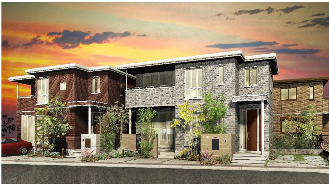
『スマートハイムシティ西宮北口』のまちなみイメージ