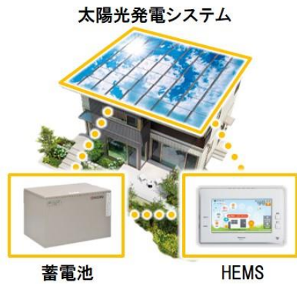
3点セット(PV、蓄電池、HEMS)を全邸搭載