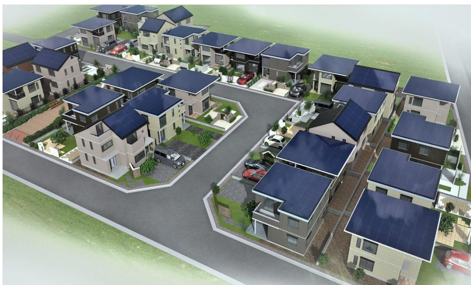
『スマートハイムシティ西宮北口』街区鳥瞰イメージ

「園の想いを継ぎ、縁を紡ぐ街」をコンセプトとし、この「歴史と現在」、「生活と文化」が交差する地にふさわしい暮らしを、セキスイハイムの際立ちである「スマート&レジリエンス」と積水化学グループのインフラ技術により実現し、長く安心して住み継がれるサステナブルなまちを目指します。