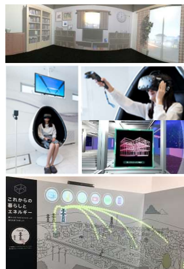
■ 家づくりの知識をバーチャル映像などで学べる「セキスイハイムミュージアム福岡」

車の移動で約 1 時間の距離にあり、福岡市中央区の当社本ビルに設置された「セキスイハイムミュージアム福岡」と『GREENMODEL PARK 唐津』を併用することで、バーチャルとリアルの相乗効果が期待できます。建築知識や住性能などのハードと実際の生活ベネフィットなどのソフトの両面を、お客様により一層分かりやすく発信し、マイホームづくりに役立てていただくことを目指します。