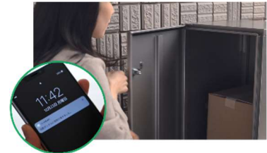
■HEMSと連携した宅配BOXの荷受け体験(イメージ)

HEMS ※3 と連携した宅配BOXにより、スマートフォンで配達状況の確認が可能 ※4 となります。宅配のデモ体験により、配達物の受取確認や再配達依頼の手間解消などの利便性が実感できます。