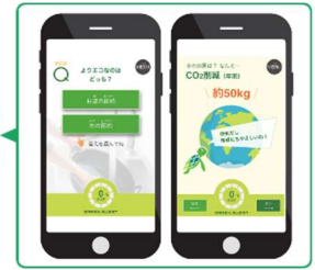
■「グリーンクエスト」でエコクイズに挑戦