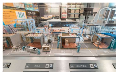
▲可動型工場ジオラマ

セキスイハイムの工場生産の全貌を再現したジオラマと共に、家づくりの各工程を解説します。タブレット端末のカメラ機能を用いてQRコード ※2 を読み込むことで、ジオラマと連動した実際の工場内建築シーンの映像をご覧いただけます。