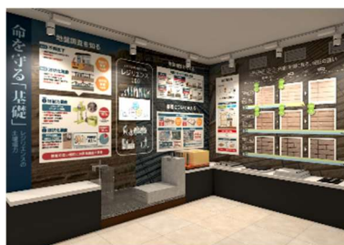
▲ハイムスタディギャラリー ※イメージ

「ハイムスタディギャラリー」においては、北東北エリアの「雪」について解説します。積雪量が多く、屋根に積もる雪が重い北東北において、家づくりの際に必ず考えておきたいことが「雪」です。雪の重さが家に与える影響や、雪を考慮した敷地の有効利用など、北東北ならではの雪に強い住まいのポイントを学んでいただけます。また、近年多発する地震をはじめとする自然災害など、身のまわりでいつ起きるか分からない脅威への備えとして重要な点や注意すべき点を解説し、北東北に住むうえでの安全・安心についてご理解いただけます。