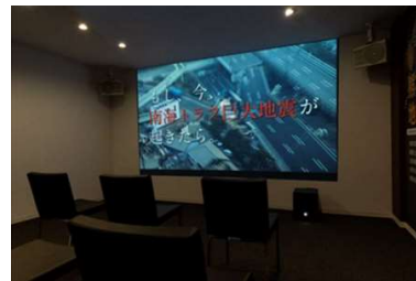
▲自然災害発生シミュレーションシアター ※イメージ

東北地方の自然災害発生シミュレーション動画などで構成された映像と大音響に加え、4D技術 ※1 （「振動」「フラッシュ演出」「風の体感」）により臨場感をもって体感していただきながら、減災住宅の重要性・必要性を解説します。