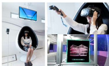
▲ハイムユニットVR ※イメージ

ヘッドマウント型の360°VR体感装置を導入し、建物の仕組みや構造、建築工程を体験できます。映像は、仮想空間バーチャルファクトリー内で、家づくり博士の「ドクターハイム」が登場するコンテンツです。アトラクション感覚で家づくりをご体感いただけます。