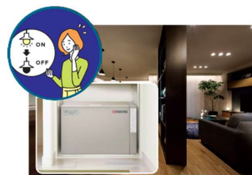
■ 大容量蓄電池(12kWh)による停電の暮らし体験(イメージ)

『GREENMODEL PARK 四日市』では、平常時では実感が難しい停電時の生活を体験いただくため、実際の停電状況を再現し、在宅避難を疑似体験していただくことが可能です。大容量の PV や蓄電池を搭載した住宅は、停電時にどれだけの電気を使用できるのか実際に体験いただけます。