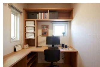
■ 在宅ワーク対応プランの体験(イメージ)

また、当社オリジナルの換気・全室空調システム「快適エアリー」による適正な換気と快適な温熱環境も体感できます。