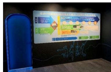
▲長期保証・サポート説明

住まい選びの決め手となる「長期保証」を、しっかり比較説明することでセキスイハイムの60年長期サポートを効果的にご理解いただき、長く安心・快適に暮らすための性能の確かさと、充実したセキスイファミエスのサポート体制が実感できます。