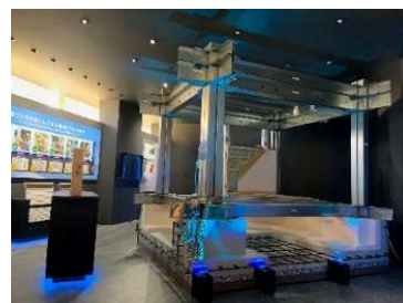
▲構造モニュメント

各種工法の特徴を模型や映像などで解説し、これからの日本の家づくりの課題をお客様とともに考えていきます。セキスイハイムの特長である工場生産やユニット工法について、構造モニュメントや各種サンプルを通して分かりやすく説明します。