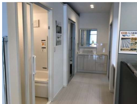
▲床段差解消のための工法紹介と浴室サイズ比較