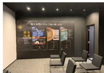
▲巨大地震体感シアター