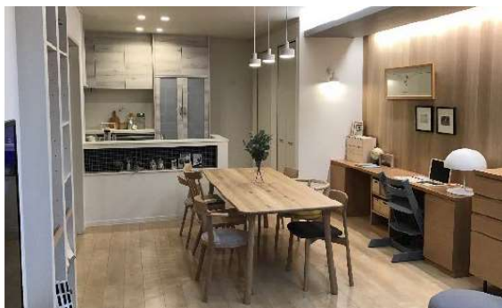
▲最新仕様の LDK に改装した空間展示