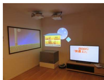
▲スマートハイム体験ルーム

また、AIスピーカーやHEMSを使った一日の生活シーンの疑似体験により、暮らしの利便性や、安心・快適な未来の暮らし方を体感いただけます。