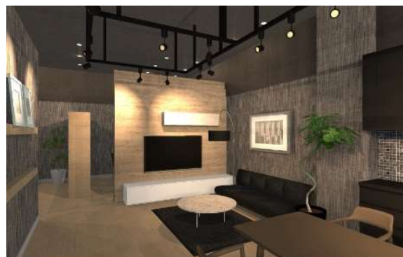
■②実物大のLDKコーナー。実際の設備に触れながら最新の住空間を体感できます。 AIスピーカーなどIoT技術を活用した暮らしの利便性もご紹介。