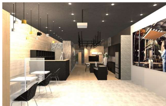
■①エントランス：オープンスペースを活用し様々なイベントを実施。ラウンジコーナーも。