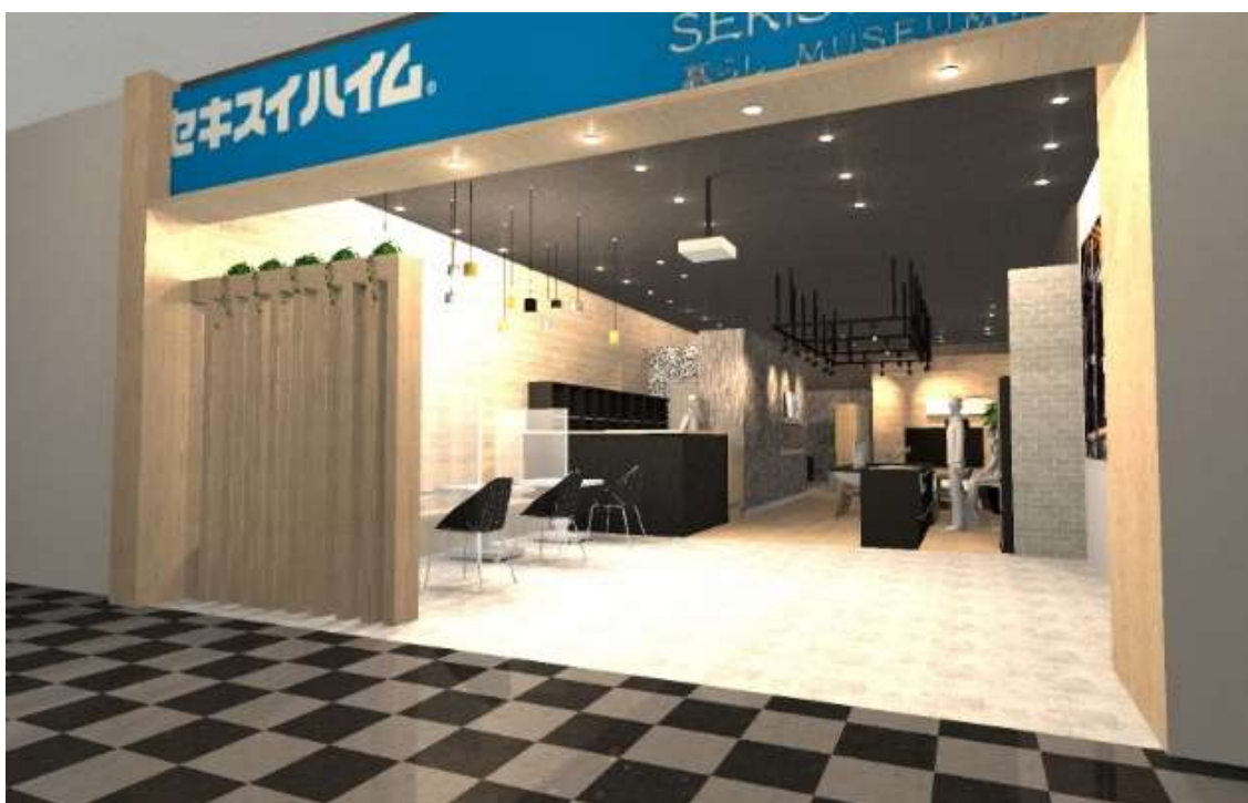
■『暮らしミュージアム利府』 エントランス