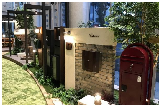
エクステリアデザイン・ゾーン