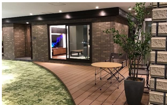
磁器タイル外装の棟内モデルルーム

収納が豊富なシステムキッチン、清掃がしやすい浴室や洗面など、水まわり設備に直接触れながら、その使い勝手をご確認いただけます。また、ご家族や仲間と楽しく過ごすためのLDKや、一日の疲れを癒す寝室について、改装例を実物大空間で展示。お客様のご要望に応じ、リフォーム後の空間をVRでご体感いただけます。