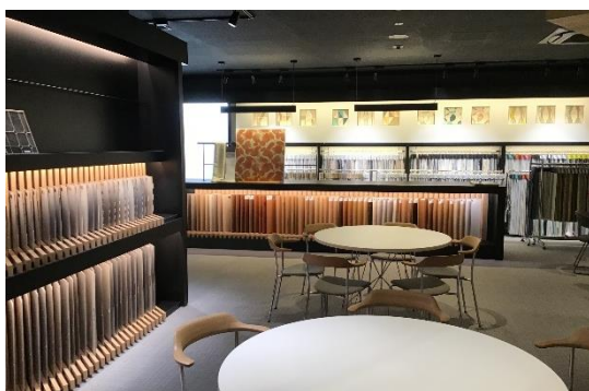
インテリアデザイン・ゾーン

吹き抜けがありゆとりのある空間を活かして、ソーシャルディスタンスを保ちつつおもてなしします。ガーデニングなどのセミナーやミニイベントの開催を進めてまいります。