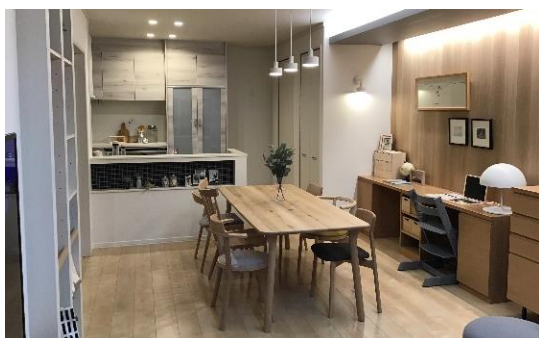
異なるテイスト・レイアウトで実際の暮らし方を体感できる2つのLDK改装実例を展示