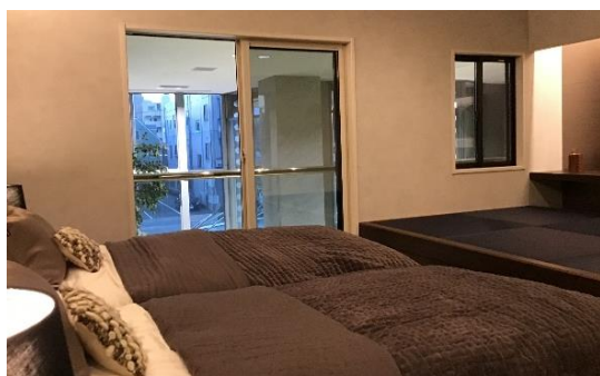
タミコーナーのある落ち着いた寝室