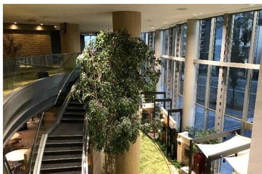
開放的なコミュニティスペース