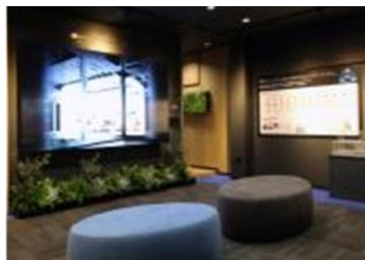
ユニット工法の特長を紹介する ウエルカムビジョン