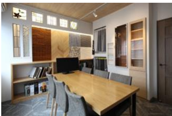
内装仕上げ材を選べる インテリアライブラリー

セキスイハイムの「60年・長期サポートシステム」の一環として、適切な時期での「住まいのメンテナンス」をわかりやすくご説明します。また、リフォーム提案に留まらず、セキスイハイムの歴史やユニット工法の特長を動画やパネルを使って改めてご案内するとともに、お住まいの定期診断※2のご報告や各種セミナー・イベントの開催などお客様とのコミュニケーションの場として活用します。