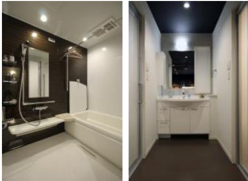
バリアフリー化した最新のサニタリー設備

また、LDK改装の一例として、セキスイハイムにお住まいの方に人気の高い対話型キッチンを採用したコミュニケーションがとりやすいLDKを実物大空間で展示。ご家族や仲間と楽しく過ごすためのリフォームのヒントをご紹介します。