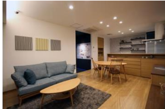
コミュニケーションがとりやすいLDKを実物大で展示