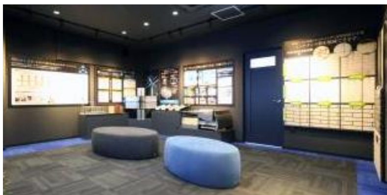
磁器タイルの外壁材やステンレス製の屋根材など 高耐久外装材を展示

『セキスイファミエスミュージアム北九州』では、環境貢献商品の中心である「再生可能エネルギーの有効活用(太陽光発電システム・蓄電池)」、「高耐久外装材(タイル外壁・ステンレス屋根)」、「省エネ性強化(高断熱サッシ)」などについて、実物サンプルやパネル、動画を使ってご案内します。