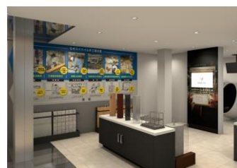
▲ミュージアムエリア(イメージ)

セキスイハイムの特長である工場生産やユニット工法についてもご説明します。なぜ工場で作るのかなぜ短工期で家が完成するのかなど、工場生産の核心に迫ります。さらに、社会や暮らしの変化、未来を見据えた住まいである「スマートハウス」についてご体感いただきます。