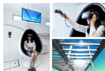
▲ハイムユニットVR(イメージ)

ヘッドマウント型の360°VR設備を導入しました。仮想空間に入り込み、セキスイハイムの構造、工場での建築工程や現場での施工工程をご覧ください。