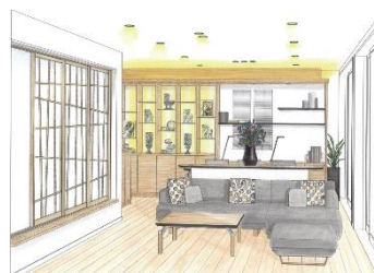
▲HIRAYA・イメージエリア(イメージ)

加賀の伝統を随所に感じる“和モダン”スタイルのインテリア空間。シックな色合いをベースに落ち着きと柔らかさを表現した北陸の住まいのための優雅な空間を、平屋の暮らしを想定した広さで再現しました。内装は東京の建築デザイン会社、勝デザインオフィスの監修です。