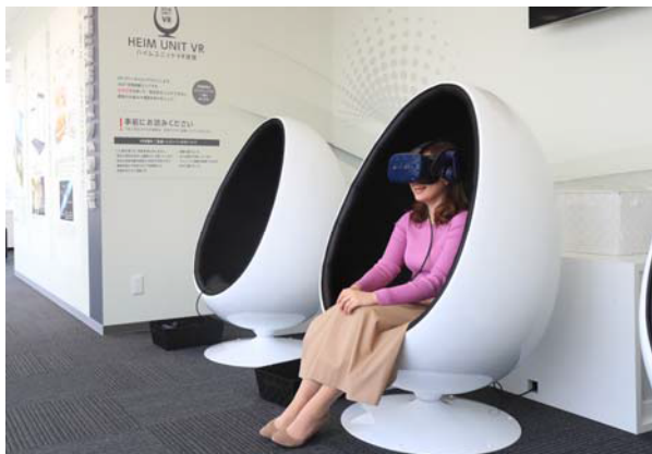
▲ハイムユニットVR体験

また、私たちの身近に潜むさまざまな脅威や危険に対するセキスイハイムの取り組みについて、ARを使ってわかりやすく学んでいただけます。『セキスイハイムミュージアム仙台』が位置する地上14階から、ARを使って豪雪や寒波、地震などの災害が起こった際の仙台の街の様子をご覧いただけます。普段意識することが少ない身近な危険について考えていただくきっかけをご提供します。