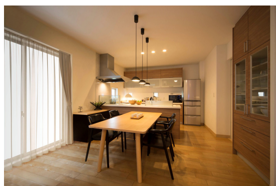
LDK を最新の仕様に全面改装した空間 を実物モデルで展示