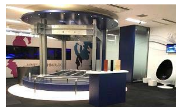
▲構造モニュメント

セキスイハイムの特長である工場生産やユニット工法について、構造モニュメントなどを使って分かりやすく説明します。また、ヘッドマウント型の360°VR体感装置「ハイムユニットVR」を当社で初めて導入し、お客様が仮想空間に入り込み、建物の仕組みや構造、建築工程を感覚的にご理解いただけます。見て触れて感じていただくことで、工場生産による品質や性能の確かさ、長期にわたってお住まいいただくための保証制度等について解説します。