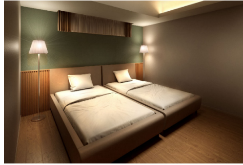
親戚・友人が宿泊できる「GUEST SUITE」※9