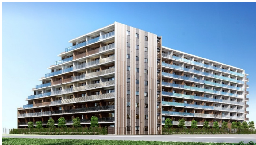
『ハイムスイート相模原横山台』外観完成予想 CG※9

H P： https://www.sekisuiheim.com/safeandsound/sgmhy-lead-town/hs-sgmhy/