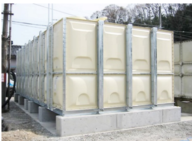
災害時に水を確保する貯水システム「貯得（ためとく）」 ※3

『ハイムスイート相模原横山台』は、立地としても標高約 122m の高台・相模野台地に位置しています。浸水想定区域を示すハザードマップにおいては浸水が想定されていない ※7 エリアであり、豪雨時も安心してお住まいいただけます。