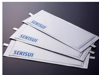
停電時でも電気が使える ※4 フィルム型リチウムイオン蓄電池