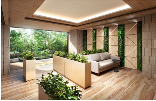
コミュニティスペース「SUITE SALON」※9

また、多彩な共用施設※8を用意しており、様々な生活スタイルに合わせた暮らしが可能です。例えば「SUITE SALON (スイートサロン)」ではカフェのラウンジのような円形テーブルやゆったりとしたソファでくつろぐことができ、「GUEST SUITE (ゲストスイート)」ではホテルライクな仕様の中、親戚や友人の宿泊スペースとしてご利用いただけます。