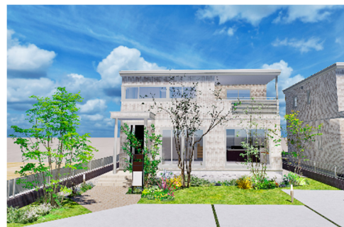
「まちなみガイドライン」を基にした緑化イメージ※8

シンボルツリーや低木、地被植物を適切に配置し、目に入る緑の量を増やすとともに、その印象を損なわないように門柱やアプローチを計画。各戸の樹木は多彩な樹種から選択でき、それぞれの住民らしさを表現できます。また、緑化は美しい景観を構築するだけでなく、外部へ流出する雨水量の抑制や生物環境の保全、