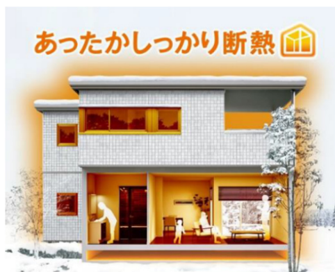
「あったかしっかり断熱」イメージ

この優れた断熱性能を実現するのは、当社の強みである工場生産による高い施工精度（気密・断熱施工）とコスト抑制を活かした「あったかしっかり断熱」です。基礎 ※10 と躯体には高性能断熱材を用い、開口部には高断熱アルミ樹脂複合サッシを採用します。地球環境にやさしく、家計にもやさしい経済的な暮らしだけでなく、夏爽やかで冬暖かい快適な住み心地を提供します。