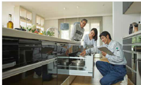
定期点検・定期診断イメージ

「60年・長期サポートシステム」により、建物の引渡しから2年目までの計3回の定期点検と5年目から5年ごとの定期診断を60年間無償で実施 ※4 。住まいの経年変化に対応するだけでなく、日々の困りごとやリフォーム、住み替え支援など、末永く快適に暮らせるアドバイスやサポートをセキスイハイムグループ全体で実施します。多世代にわたって価値が続くことで、地域活性化や空き家発生の抑制にも寄与し、サステナブルなまちを実現します。