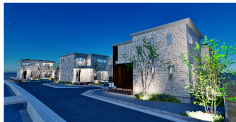
防犯性向上も考慮した外部灯設置イメージ ※8

住み続けるほどに魅力が増し、住民同士のコミュニケーションを広げ、賑わいのあるまちを目指します。