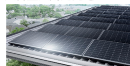
大容量太陽光発電システム

工場で生産する強靱なユニット構造体により、高い耐震性を確保し、災害から大切な家族の命と財産を守ります。また、大容量PVと蓄電池、HEMSにより、昼も夜もできるだけ太陽光から生み出した電力を活用し、万が一の停電時には、夜間でも家じゅう同時に電気を供給することができます※2。これにより、テレビ視聴や携帯電話の充電ができるため、通信手段の確保と自宅での情報収集が可能。消費電力の大きい調理家電や空調も使用できるため、停電時でも普段に近い生活を送ることができます。さらにHEMSは気象情報に連動しており、大雨や暴風などの警報が発令された際には停電に備えて自動で蓄電池への充電を開始します※7。