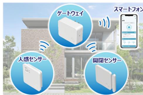
窓などからの侵入を検知するホームセキュリティ

まち全体で防犯意識を向上させることで、安心して長く暮らせるまちづくりを目指します。