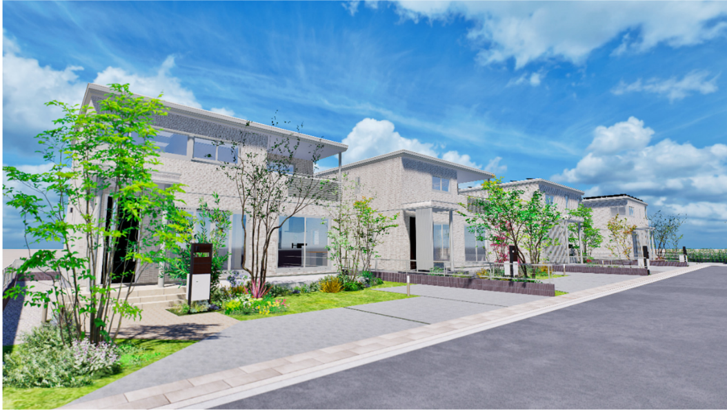
『ユナイテッドハイムパーク片山』のまちなみイメージ※8