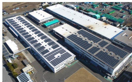
工場に設置した太陽光発電設備

当社の住宅はその大半を自社グループの工場生産しています。建設・生産過程の中心となる工場の環境負担軽減と電力自給を目的に、工場へのPV設置を推進しており、現在その発電出力（パネル容量）は全10工場合計で約9.8MWにのぼります。また、生産設備の自動化や省エネ設備の導入により、工場での消費電力を2013年度比で約13%削減。さらに、電力売買サービス「スマートハイムでんき ※5 」では、セキスイハイムオーナーのPVから生じた非化石価値を証書化し、実質再エネとして当社グループの工場や事業所などに供給しています ※11 。