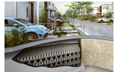
豪雨に備える雨水貯留・浸透槽「クロスウェーブ」

また、停電時でも電気が使えらる蓄電池 ※2 を全邸で採用しています。万が一の停電時も灯りやスマートフォンの充電、冷蔵庫の電源など生活に必要な電力を確保することで、家族の安心を保ち、災害時の在宅避難 ※10 を可能にします。