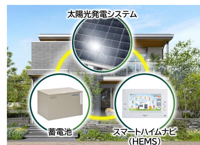
3点セット(PV、蓄電池、HEMS)を全邸搭載

快適な室内環境の確保やカーボンニュートラル社会への貢献を目指し、全邸を『ZEH』仕様※3とします。高い品質管理のもと大半が工場生産される高気密・高断熱の躯体性能をベースに、PV(4kW以上推奨)、蓄電池(4kWh以上※6)、HEMS「スマートハイムナビ」の3点セットを全邸で採用。可能な限り自然エネルギーを活用し、電力価格高騰リスクにも対応するクリーンな暮らしを実現します。