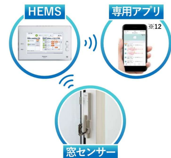
窓施錠解錠開閉見守りシステム

自然災害時の安心だけでなく日常の安心も確保するため、窓施錠解錠開閉見守りシステムを全邸に設置します。警察庁のデータによると、泥棒などの侵入窃盗犯罪数は一戸建てが多く、一番狙われやすいのは窓からの侵入です ※11 。センサーを設置した窓の施錠状態を HEMS モニターでまとめて確認できるほか、外出中に窓が開いた時にはスマートフォン ※12 への通知も行うため、速やかに異常を知ることができます。まち全体で防犯意識を向上させることで、安心して永く暮らせるまちづくりをサポートします。