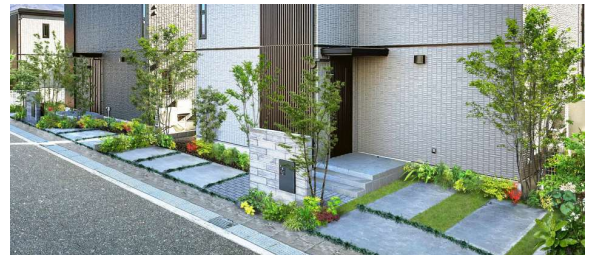
リズム感のある連続した緑の風景