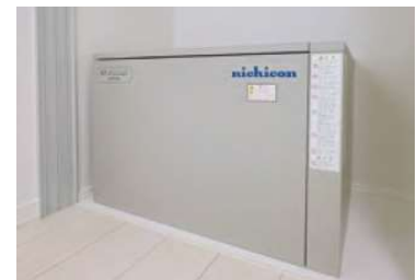
災害後の生活も守る蓄電システム ※2