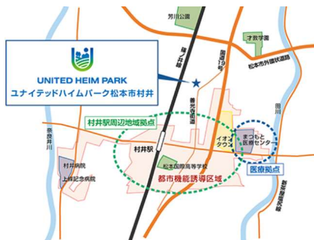
都市機能が充実したエリア

このような未来への期待が高まるエリアで、美しく統一されたまちなみを維持するため、自然な街区形状とフラットな地勢を活かしたランドプランを行い、まちの価値を向上する洗練されたデザインの分譲住宅を建築しました。