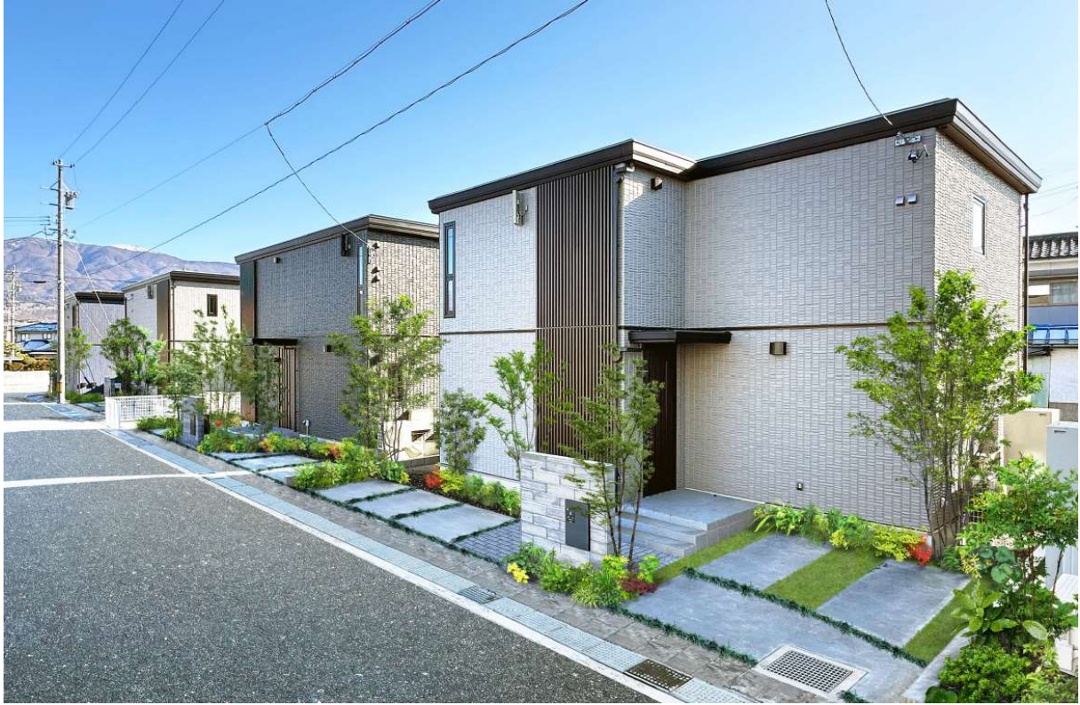
『ユナイテッドハイムパーク松本市村井』のまちなみ※13