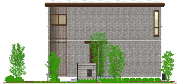
化粧格子をアクセントとしたシンプルモダン外観

さらに区画ごとにシンボルツリーとサブツリー、低木や地被類を適所に配置をし、建物・外構とのバランスを取りながら組み合わせることで、リズム感のある連続した緑の風景をつくりだします。